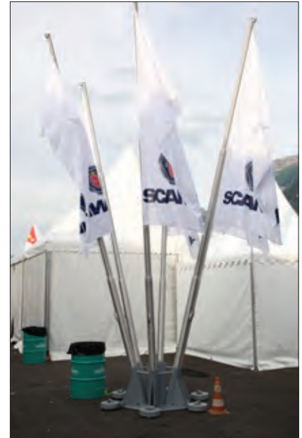
Mobilspinne, 6-fach Die Besonderheit dieser Halterung liegt im integrierten Ballastsystem und in der einfachen und sicheren Handhabung.

Support multiple mobile, sextuple La particularité de cette fixation se trouve dans le système ballast intégrée et dans l'utilisation simple et assurée.