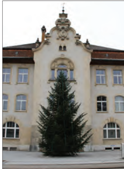
Hülsen für Weihnachtsbäume Für Baumgrößen von 8 - 25m und mit Elektroanschluss für eine Baumbeleuchtung.

Mât télescopique Boulevard Mât de drapeau mobile qui s'assemble et se démonte sans outil.