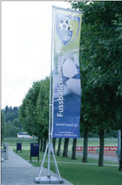
Boulevard-Teleskopmast Mobiler Fahnenmasten, der ohne Werkzeug aufgebaut und wieder zerlegt werden kann.

Mât télescopique Boulevard Mât de drapeau mobile qui s'assemble et se démonte sans outil.