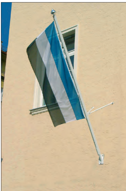
Fahnenmasten für Fassadenmontage (für Hängefahnen).

Support multiple mobile, sextuple La particularité de cette fixation se trouve dans le système ballast intégrée et dans l'utilisation simple et assurée.