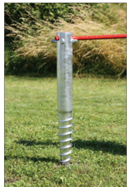
Schraubenfundament Geeignet für temporären Einsatz.

Récipient mobil avec tank d'eau et support de remplir et dégorger.